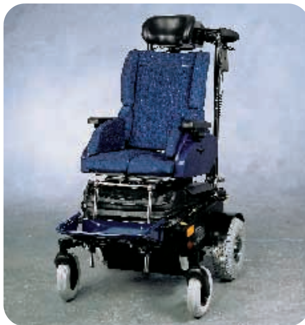
Scoop udstyret med Simba skalsæde