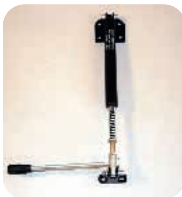
Rygjustering med gasfjeder