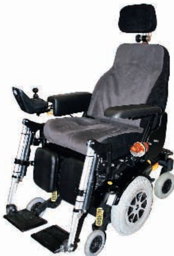
Stol med Spinalus Modul ryg

Det specielle ved Spinalus Modulryggen er, at den kan justeres på stedet til brugere med atypisk rygform, som f.eks. skoliose, kyfose etc. Dette kan gøres ved, at rygrørene på begge sider er leddelte og justerbare to steder. Desuden har ryggen justerbare velcrobånd, så det er nemt at opnå den ønskede form. Ryggen er endvidere vinkeljusterbar (manuelt eller elektrisk), og sædedybden er justerbar.