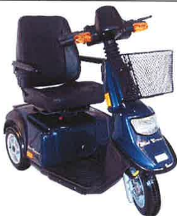
Mini Crosser T-model