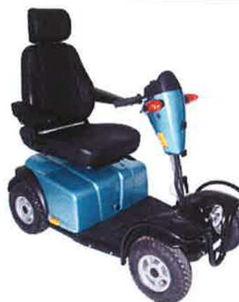
Mini Crosser E-model, Nordic