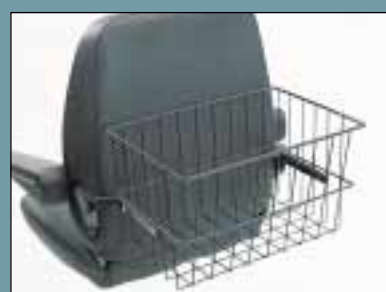
Bagagekurv. (Varenr. S5-0350)