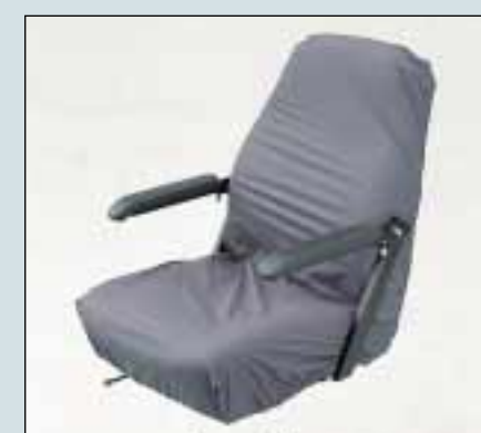
Vandtæt sædeovertræk. Voksen (Varenr. S2-0950) Barn/junior (Varenr. S2-0950)