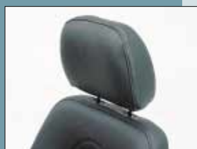
Nakkestøtte. (Varenr. S2-0031)