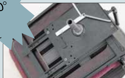
Glideskinne er standard på alle modeller på nær standard KABSæde og sportsæde. Vandring 19 cm

Alle sæder er - Højdejusterbare - Kan drejes 360° - Klimatestet - CE-godkendt