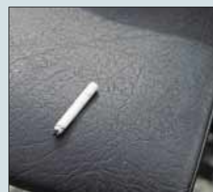
Alle sæderne er brandtestet efter ISO