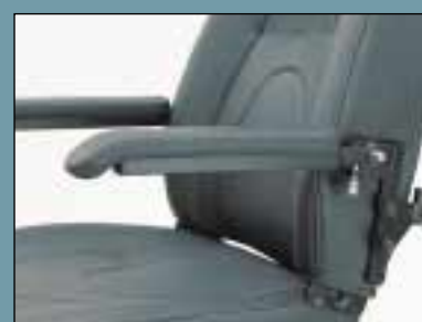
Højdeindstilleligt armlæn. Højre (Varenr. S2-0110) Venstre (Varenr. S2-0111)