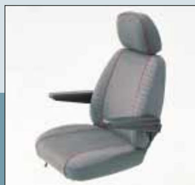
Stof sædeovertræk. (Varenr. S2-0034)

Standard KABSæde uden glideskinne. Varenr. S2-0035. HMI 27904. KABSæde med glideskinne. Varenr. S2-0030. HMI 27905.